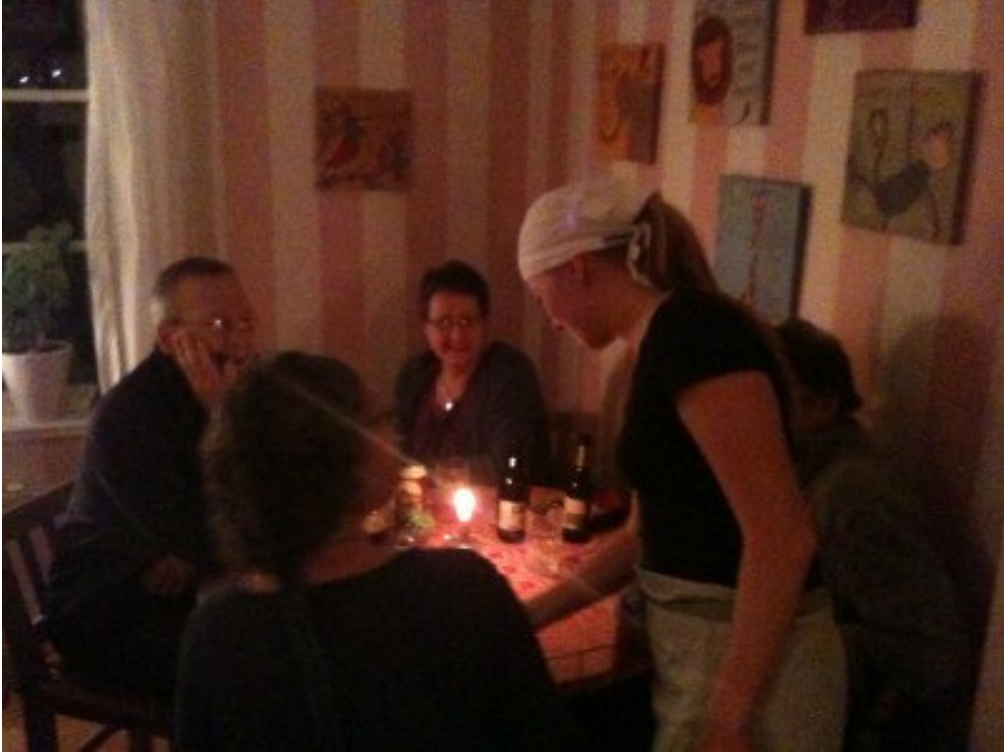
Det södra rosarandiga rummet är lämpligt för ca 16 sittplatser. Ena väggen pryds av en naturinspirerad och spännande bildtapet. Rummet är möblerat med stolar, bord och kökssoffor i loppisstil.